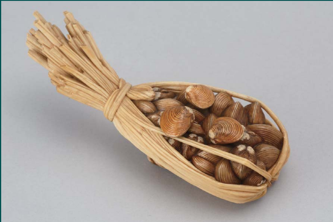
牙彫芭苴蜆置物 大正12年(1923)、有栖川宮董子妃(熾仁親王妃)御遺物として鍋島栄子拝領