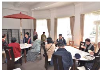
2階でお抹茶を楽しむ来館者