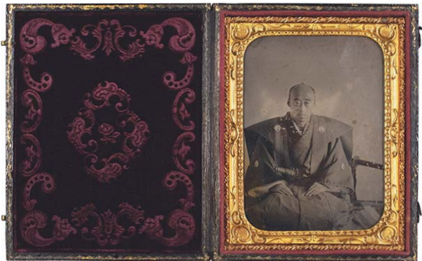
鍋島直正肖像写真 6枚のうち1枚 安政6年(1859) 川崎道民 撮影

直正公の肖像として、博物館やメディア等で目にすることも多く、一般によく知られたお写真ですが、この度の指定を機に改めてその資料性も含めた歴史的価値を再認識するとともに、今後も佐賀の地で大切に受け継いでいきたいと思えます。