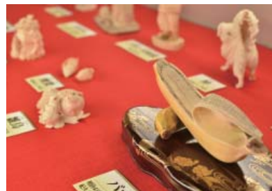
バナナ棚飾(右下)をはじめ、象牙細工