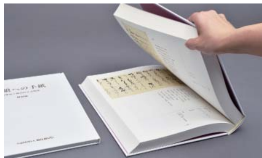
A4版フルカラー・上製本・箱入 / 25,000円(税込)

従来、直正公の藩主としての業績は伝記や研究書によって知られ、郷土の偉人として敬愛され、時に「名君」とも謳われてきました。それに対し、愛娘のことを想いながら自らの言葉を自らの筆で綴った手紙は、貢姫をはじめとする人々への情愛を感じさせる内容に溢れており、直正公の父としての姿やその人物像に迫り得るものです。