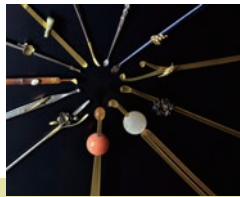
栄子さまの髪飾り (8月26日~10月19日)