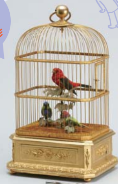
雌雄小禽入金色鳥籠