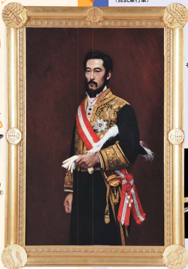
鍋島直大像 (百武兼行筆)