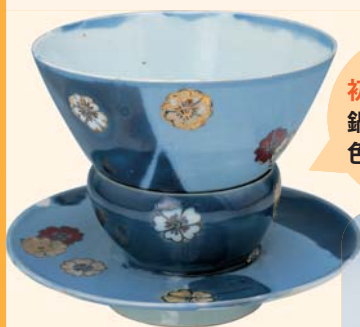
色絵茶碗(瑠璃地桜花散らし文)台共